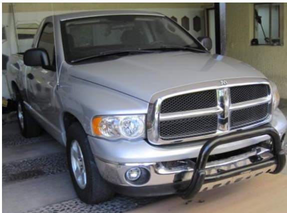
Dakar, Bunker, Rhino Charger instalado